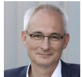
Alt Regierungsrat Bernhard Pulver, Grüne