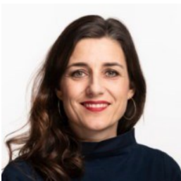
Nationalrätin Flavia Wasserfallen, SP